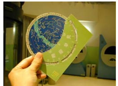
星座早見盤のできあがり!