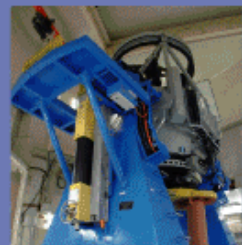
国内最大の2m望遠鏡「なゆた」

一般の方が利用できる公開望遠鏡 としては世界最大です。 のぞいてみると、14億光年先の天体 が見えて特殊なカメラを使うと宇宙 の果てと言われている137億光年先 まで計算上は撮影できます。