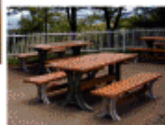
●バーベキューサイト